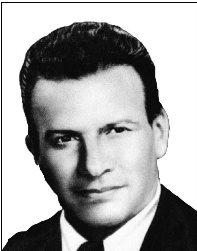
V.M. Samael Aun Weor